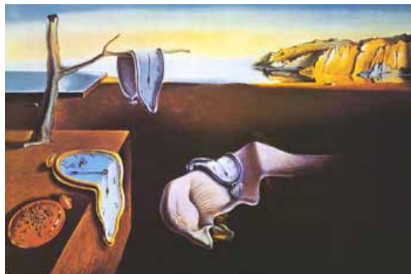
Dali, S. 1931

Se requiere una cantidad exacta de tiempo para que una pieza pueda ser armada o fabricada con un determinado material y ese tiempo difiere del que necesitaría la misma pieza si el material fuera distinto. En el tráfico (terrestre-marítimo y aéreo), los movimientos están sujetos a los tiempos y se deben considerar para sincronizarse con otros factores.